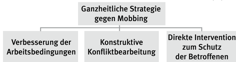
Abb. 3: Verantwortung der Leitung

NACH: GEMEINSAM GEGEN MOBBIING. BROSCHÜRE VON VER.DI UND IG METALL, FRANKFURT/M 2007