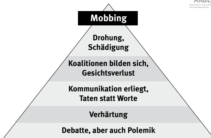
Abb. 1: Mobbing als Spitze des Eisbergs

gute ARBEIT. Zusätzlich für Gesundheitsmanager und Arbeitsgestaltung