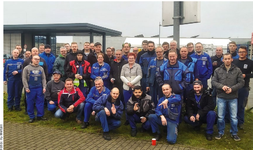
Mittagspausenaktion Firma Meleghy

In den nächsten Wochen werden sie auf Mitgliederversammlungen tiefer in die Diskussion darüber einsteigen, was sie tun müssen, um in Sachen Tarifbindung vorwärts zu kommen, denn »wir haben die Hoffnung noch lange nicht aufgegeben«.