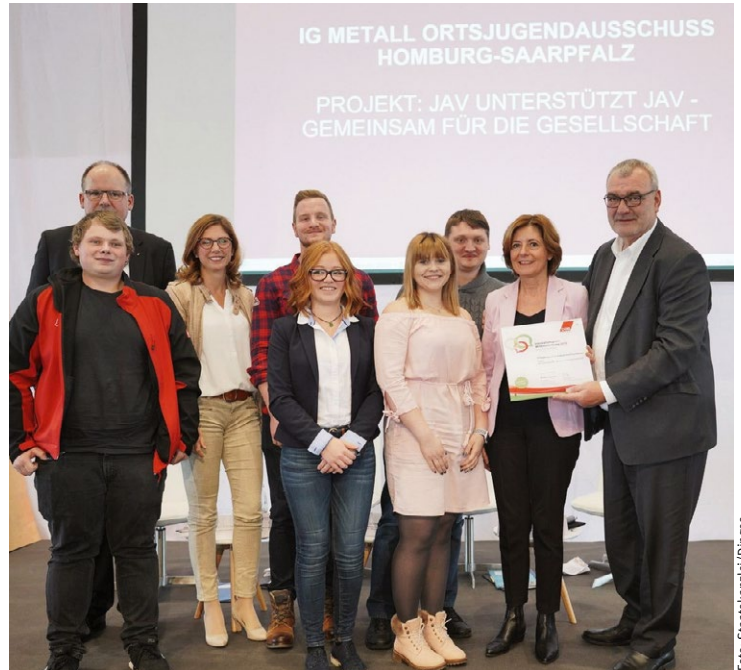
Preisverleihung auf dem Betriebs- und Personalräteforum Rheinland-Pfalz