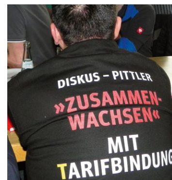
Das Ziel ist klar: Tarifverträge für Pittler und Diskus

Die Geschäftsleitung versucht, das auszusetzen. Dann muss der Druck eben verstärkt werden, um sie zu Tarifverhandlungen zu zwingen.