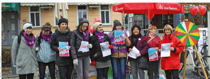
Aktion zum »Tag zur Beseitigung von Gewalt gegen Frauen«.

Unser Arbeitsjahr beginnt mit einer Besprechung aller Gewerkschaftssekretäre und Verwaltungsangestellten der Geschäftsstellen. Ihr erreicht uns anschließend wieder, und das heißt, am 6. Januar 2020 ab 13 Uhr.