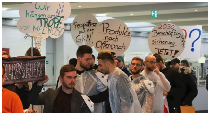
Aktion der Kollegen bei der Betriebsversammlung am 23. November