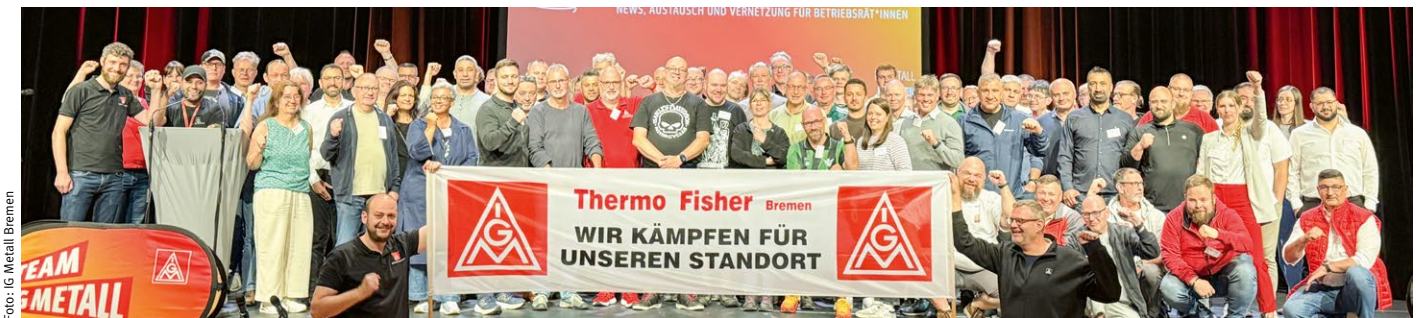
Die auf der BR-Info-Tagung anwesenden Betriebsräte stehen solidarisch an der Seite der Belegschaft von Thermo Fisher.

Die Gespräche mit der Geschäftsführung laufen jetzt an. Die Belegschaft und die IG Metall zeigen sich kampfbereit.