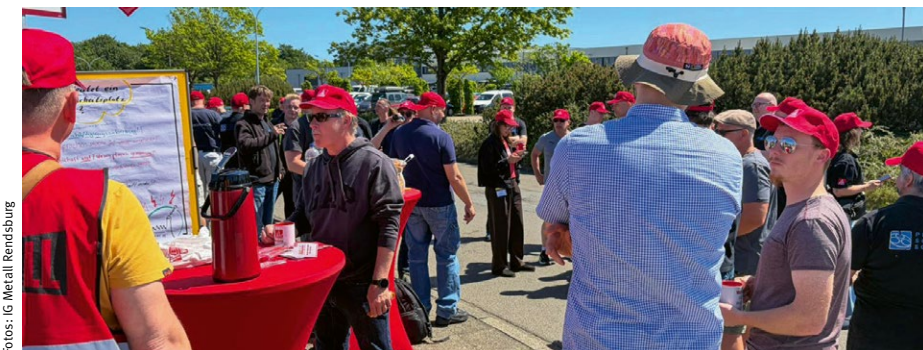
Die Streikenden vor dem Betriebsgelände von Lapmaster Wolters.