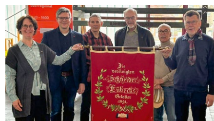
Metaller bei der Fahnenübergabe

Ein Bild, das lange unbeachtet in der Geschäftsstelle der IG Metall Lübeck-Wismar hing, erweist sich als wertvolles Zeugnis der Gewerkschaftsgeschichte: Die Fotografie des DMV-Ortsverbands Lübeck (Deutscher Metallarbeiter-Verband) von 1926 wurde von der AG Geschichte der IG Metall erforscht und feierlich im Industriemuseum Herrenwyk vorgestellt. Neben den Biografien der abgebildeten Menschen beleuchtete die Präsentation auch die Historie des Gewerkschaftshauses an der Johannisstraße 50 mit seinem Saal und Kaffeegarten als Zentrum der Arbeiterbewegung. Zudem gab es Einblicke in die Lübecker Betriebe und Arbeitswelt der Beschäftigten vor rund 100 Jahren.