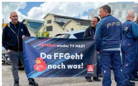
Zeichen setzen für 100 Prozent Metall- und Elektro-Tarif bei 100 Prozent Arbeit!

Der Arbeitgeber in Flensburg mit den dicksten Auftragsbüchern und einer Riesennachfrage nach Arbeitskräften