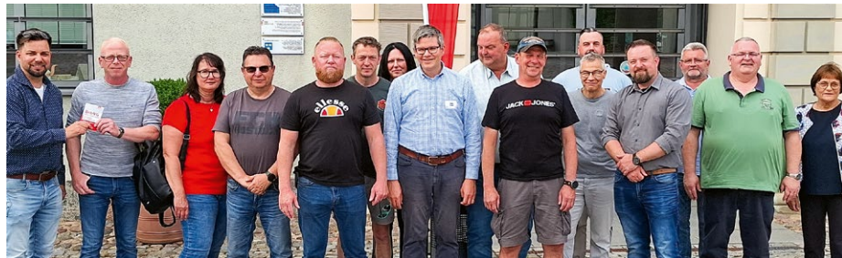
Betriebsräte tauschten sich bei den Empfängen in Wismar (Foto oben) und Lübeck (unten) aus.

BETRIEBSRÄTEEMPfang Die Kolleginnen und Kollegen setzen wichtige Impulse für die gemeinsame Arbeit.