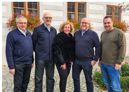
Auch bei Airbus in Manching ist die IG Metall mit über 85 Prozent stärkste Kraft im Betrieb.

großer Bedeutung – denn Demokratie beginnt am Arbeitsplatz. Besonders begrüßen wir, dass das verstärkte Auftreten sogenannter rechter Listen verhindert werden konnte. Für uns ist klar: Wir stehen für Zusammenhalt und stellen uns entschieden gegen jede Spaltung von Belegschaften und der Arbeiterklasse.«