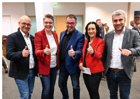
Bei Audi in Ingolstadt ist die IG Metall mit über 82 Prozent stärkste Kraft im Betrieb.