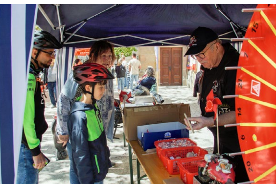
Stand am 1. Mai

TAG DER ARBEIT Die Metallerrinnen und Metaller sammeln auch in diesem Jahr wieder Spenden für den guten Zweck.