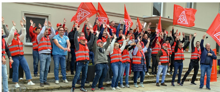
Die Teilnehmer des Geschäftsstellenprozesses in Aktion

Redaktion: Wolfgang Nirschl (verantwortlich) Anschritt: IG Metall Passau, Salzweiger Str. 5, 94034 Passau Telefon: 0851 560 99-0, Fax: 0851 560 99-30 passau@igmetall.de, passau.igmetall.de