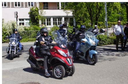
Zieleinfahrt beim Toy Run am 2. Mai