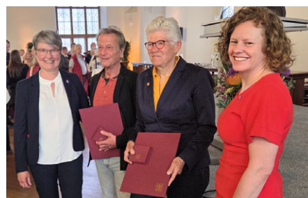
Die Bevollmächtigten der IG Metall München beglückwünschten die beiden Geehrten.

Über viele Jahre hinweg war sie Vorsitzende der Gesamt- und Konzernschwerbehindertenvertretung, und sie setzte sich konsequent für die Inklusion von Menschen mit Behinderung ein. Die von ihr mitgestalteten Inklusionsvereinbarungen gelten bis heute als vorbildlich. Auch über ihr Berufsleben hinaus engagiert sie sich in beeindruckender Weise ehrenamtlich.