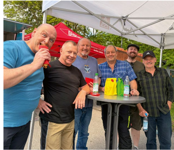
Gute Laune und Bosna zum Aktionstag bei Schörghuber

Bei Bosna unter freiem Himmel wurde nicht nur diskutiert, sondern auch Zusammenhalt sichtbar. Für Betriebsrat und IG Metall ist klar: Ein Tarifvertrag soll Lösungen bringen – für gute Arbeit mit fairen, verlässlichen Regeln.