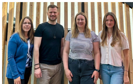
Mit unserem neu gewählten Betriebsrat sind auch wir in der Geschäftsstelle wieder gut aufgestellt.

»Wir werden uns gemeinsam auch in Zukunft mit den Ingolstädter Metallern und Metallern stark machen – füreinander und für unseren Standort. Für das, was wirklich zählt: arbeiten, wo wir leben. Für Perspektiven für uns und unsere Familien«, so die Gewerkschafter.