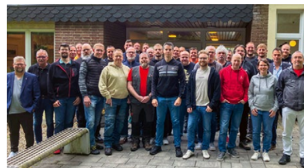
Vertrauensleute und Betriebsratsmitglieder haben sich am 8. Mai in Bovenden auf die Tarifrunde 2026 vorbereitet.