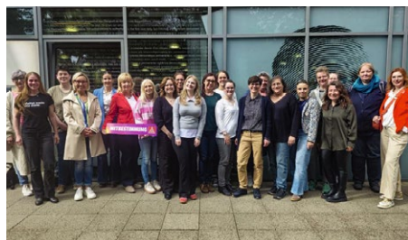
Empfang für Betriebsrätinnen am 20. Mai

FÜR EINEN GUTEN START Erfolgreiche Empfänge für Betriebsräte