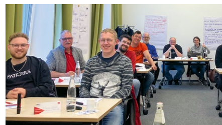
Zum Start der Tarifrunde lief das Vertrauensleute-Seminar im Mai in Bovenden: »Gewerkschaften im Betrieb – mehr als Tarifmaschinen«. Parallel lief ein Seminar für die Vertrauensleute von Sartorius. Der Abschluss für alle war die Konferenz zum Tarifauftakt.