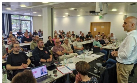
Empfang neuer Betriebsratsmitglieder am 2. Juni

Von März bis Ende Mai haben dieses Jahr wieder die Betriebsratswahlen in Deutschland stattgefunden. Über 500 Betriebsräte wurden allein im Organisationsbereich der IG Metall Hannover gewählt. Damit übernehmen die Kolleginnen und Kollegen wichtige Aufgaben zur Wahrung der Interessen der Beschäftigten in den Betrieben und der Demokratie auf betrieblicher Ebene.