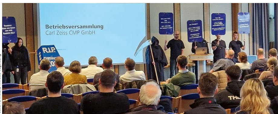
Aktion der Vertrauensleute am 24. April 2026 auf der Betriebsversammlung

ZEISS CMP IN GÖTTINGEN Erst in einem Schlichtungsverfahren wird ein Interessenausgleich erzielt, da der Arbeitgeber zunächst alternative Vorschläge zum Stellenabbau blockiert.