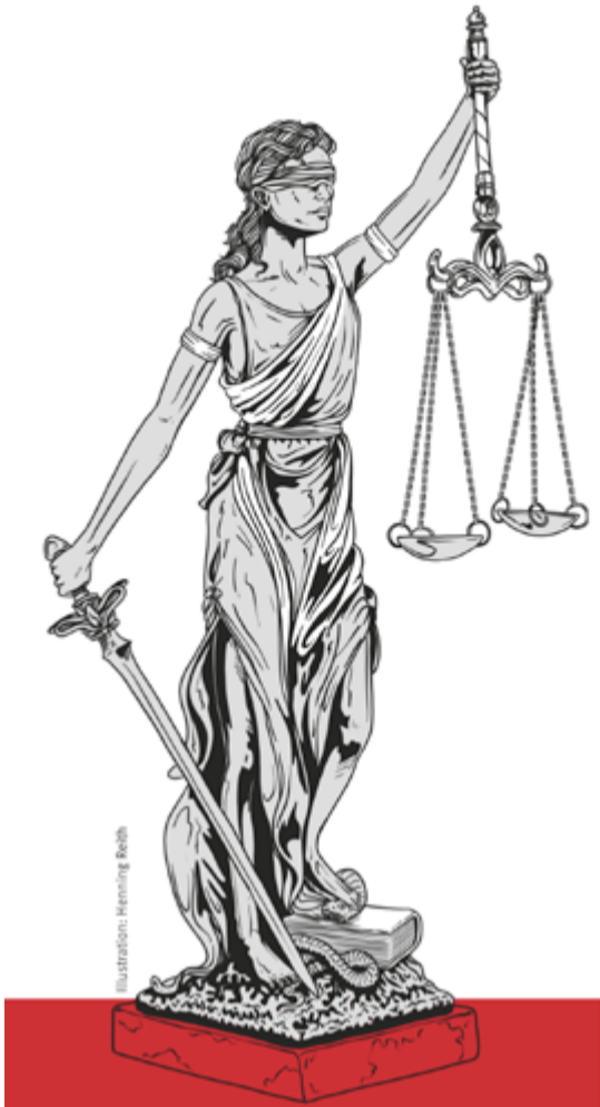
Illustration: Henning Reith