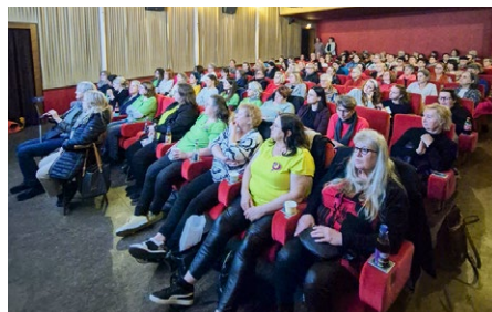
Der Saal war bis auf den letzten Platz besetzt.

Mit strahlenden Augen, guter Stimmung und einer ordentlichen Portion Frauenpower füllten rund 100 Teilnehmerinnen am 12. März das KUK Schweinfurt zum Kinoabend des IG Metall-Frauenteam anlässlich des Internationalen Frauentags. Die Nachfrage war so überwältigend, dass sogar einige Interessentinnen leider keinen Platz mehr bekommen konnten. Bevor der Film startete, zeigte