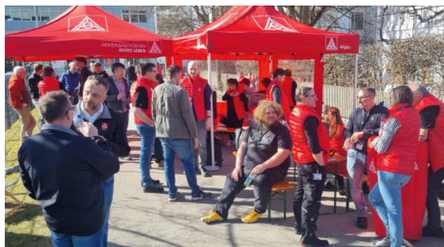
Der Aktionstag bei Multivac Ende Februar war ein voller Erfolg. Er hat gezeigt: Die Belegschaft hat ein großes Interesse an Mitbestimmung.