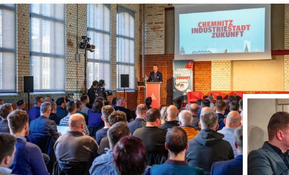
Zukunftskonferenz am 17. März 2026

ZUKUNFTSKONFERENZ Im März drehte sich im Industriemuseum in Chemnitz alles um die Zukunft der Industrieregion Chemnitz. Rund 130 Gäste – darunter Betriebsrätinnen und Betriebsräte, Arbeitgeber der Region, Gäste aus Politik und Wissenschaft – diskutierten über den Weg in die Zukunft. Am Nachmittag wurde die Chemnitzer Erklärung vorgestellt. Ministerpräsident Michael Kretschmer begrüßte die »Liebeserklärung der Metaller für die Region und an den Standort«.