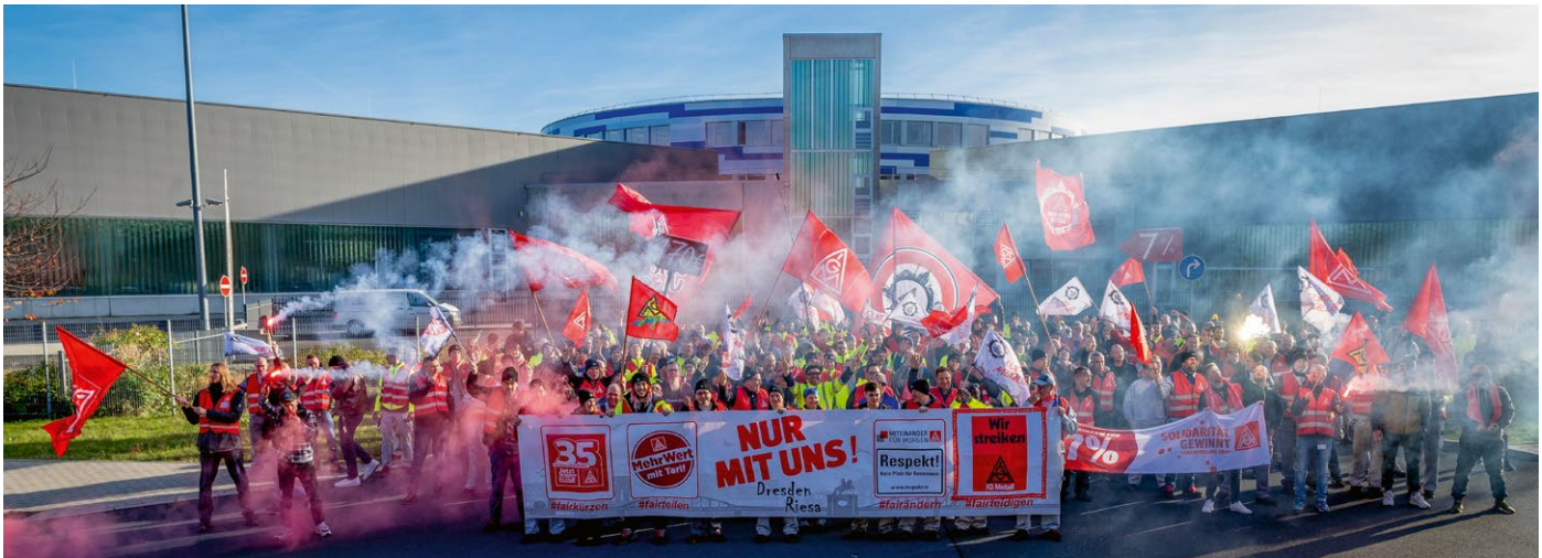
Warnstreik bei Purem in der letzten Tarifrunde

TARIFBEWEGUNG Die Entscheidung des Arbeitgeberverbands VSME, Purem Wilsdruff trotz erfüllter tariflicher Zusagen nicht aufzunehmen, sorgt in der IG Metall für massive Kritik.