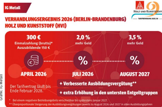
Tarifabschluss Holz und Kunststoff

»Wir gratulieren zur Anerkennung des bisherigen Engagements und freuen uns auf die weitere Zusammenarbeit«,