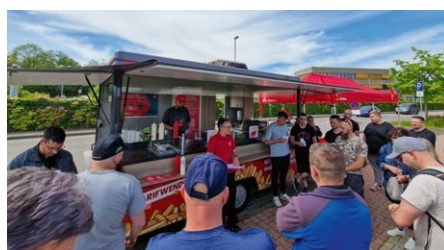
Aktive Mittagspause bei KEB