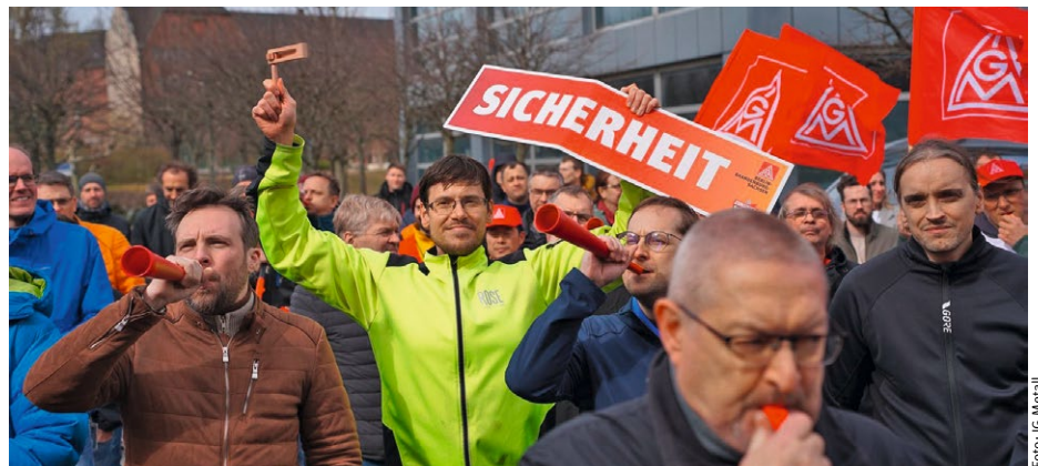
● In Berlin (Bild) und Stollberg tragen die IAV-Beschäftigten ihren Protest auf die Straße. Sie kämpfen gemeinsam mit der IG Metall gegen weiteren Kahlschlag im Unternehmen.

Unterstützung bekamen sie auch aus der Politik. In Berlin forderte Kai Wegner, Regierender Bürgermeister, das Management auf, Verantwortung zu übernehmen: »Es geht um eine verlässliche Perspektive für die Beschäftigten und zugleich darum, Voraussetzungen zu schaffen, damit IAV seine Rolle als Entwicklungs- und Ingenieurdienstleister aktiv weiterentwickeln kann – mit neuen Ideen, Produkten und Kunden.« Auch Sachsens Ministerpräsident Michael Kretschmer stellte sich an die Seite der Beschäftigten. »Der Standort Stollberg steht für Kompetenz, Innovationskraft und Wertschöpfung in der Region«, so Kretschmer. »Ziel muss sein, Arbeitsplätze zu sichern und die Transformation der Automobil- und Zulieferindustrie zu sichern.«