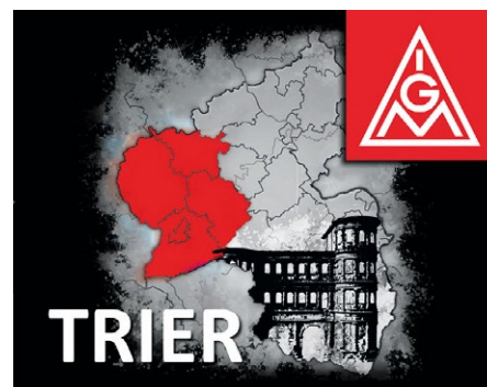
Fahne der IG Metall Trier

Künftig bieten wir außerdem regelmäßig betriebliche Sprechstunden an. Ein Gewerkschaftssekretär und eine Ver-