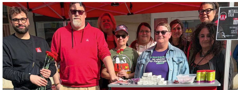
Auch 2026 beteiligte sich die IG Metall Arnsberg mit einem Infostand am Internationalen Frauentag.