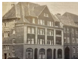
Das erste Geschäftsstellenbüro befand sich im Büttnerschen Haus an der Gütersloher Kaiserstraße.