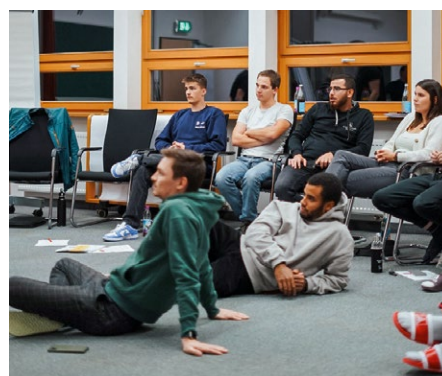
Mit dem Team IG Metall ist für die neuen Auszubildenden und dual Studierenden von Anfang an mehr drin – herzlich willkommen.