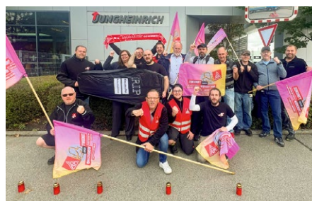
Kämpferisch: Aktive in Moosburg setzen Zeichen.

In Lüneburg soll das Werk komplett geschlossen, in Norderstedt sollen rund 200 Stellen abgebaut werden. »Wir lassen nicht zu, dass Standorte gegeneinander ausgespielt werden«, betonten die Betriebsräte und Vertrauensleute der IG Metall vor Ort. Die Aktionen in Bayern zeigen: Der Widerstand gegen die Kahl Schlagpläne des Vorstands ist breit und entschlossen. Transformation darf nicht Stellenabbau und Verlagerung ins Ausland bedeuten – wir stehen für eine faire und zukunftsfähige Transformation mit den Beschäftigten.