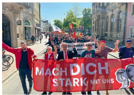
Demozug am 1. Mai