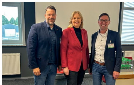
Im Austausch mit Bärbel Bas

Am Rande des SPD-Landesparteitags in Landshut tauschten sich Benjamin Freund von der IG Metall Landshut, Rudi Lang, Betriebsrat von Dräxlmeier, und weitere Gewerkschaftsvertreterinnen mit Bundesarbeitsministerin Bärbel Bas zur Zukunft des Industriestandorts Deutschland aus. Die Botschaften der Metalloberinnen und Metallober: In Zeiten großer Umbrüche und Herausforderungen braucht es ein klares Bekenntnis zu