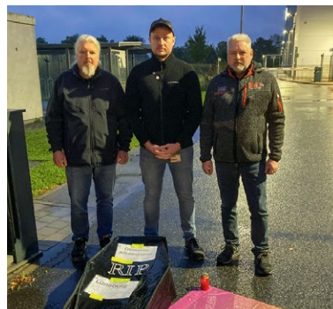
Auch Jungheinrich Degernpoint zeigt Solidarität.