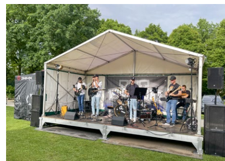
Aktivenfest: »Woodstone« sorgte für Stimmung.