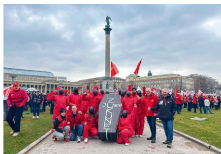
Aktionstag in Stuttgart am 15. März