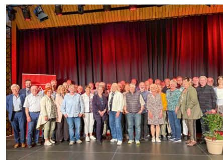
Jubilärfest der IG Metall Bamberg im Kulturboden: Mitglieder mit 40 Jahren Zugehörigkeit zur Gewerkschaft