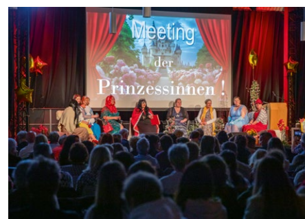
Frauentag – »Meeting der Prinzessinnen«