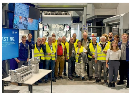
Der Seniorenarbeitskreis bei der Besichtigung der Gießerei.

Der Seniorenarbeitskreis der IG Metall Landshut trifft sich einmal im Monat, um aktuelle Themen aus den Betrieben, aus der Politik oder der gesellschaftlichen Debatte zu diskutieren. Die Termine der kommenden Sitzungen und alle weiteren Themen und Aktivitäten der IG Metall-Senioren können in der Geschäftsstelle erfragt werden.