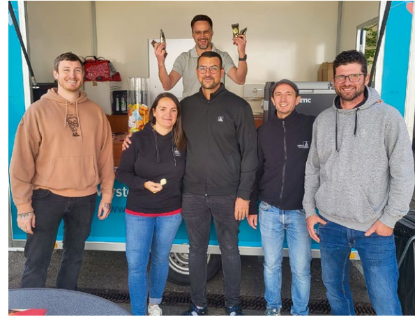
Vertrauensleute mit Herz und Eis – an der »Rosk« gab es nur Gewinner!

Fazit: Dieser Tag war mal erfrischend anders – so schmeckt Gewerkschaft!