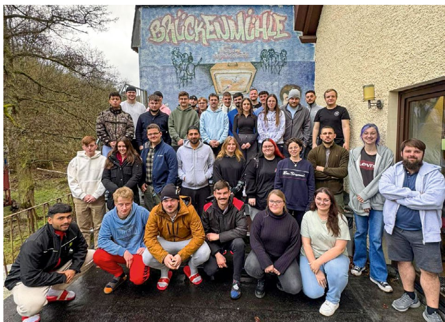
Jugend- und Auszubildendenvertreterinnen und -vertreter aus dem Bereich der Geschäftsstelle

In den Betrieben haben Begrüßungsrunden für die neuen Kolleginnen und Kollegen stattgefunden, bei denen sich viele für eine IG Metall-Mitgliedschaft begeistern ließen. Wir freuen uns über alle, die sich aktiv einbringen möchten, denn die Herausforderungen sind groß: Strukturwandel, Digitalisierung und Mobilitätswende betreffen besonders junge Beschäftigte.