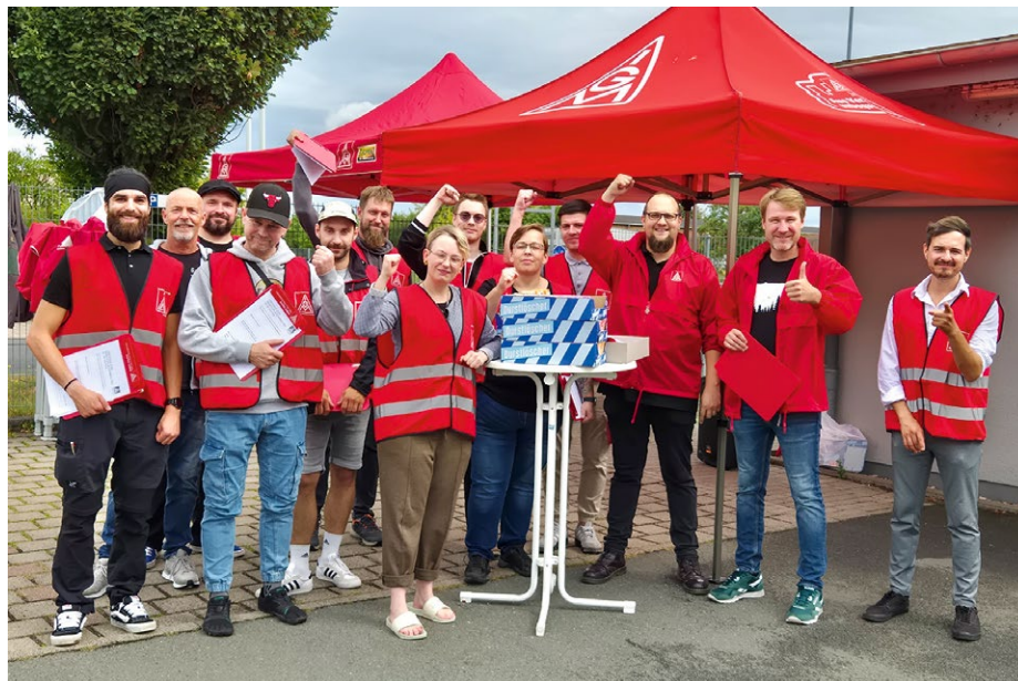
Das A-Team im Einsatz vor dem Tor bei ZF in Gotha

ERSCHLIESSUNG Ansprache-Team für die Geschäftsstellen Eisenach und Suhl-Sonneberg gegründet