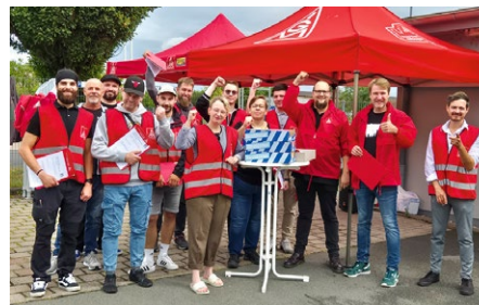
A-Team im Einsatz vor dem Tor bei ZF in Gotha

mit vielen kreativen Angeboten und Hüpfburg auf ihre Kosten. Ein besonderes Highlight war unsere Tombola, bei der viele tolle Preise verlost wurden. Der Erlös in Höhe von 580 Euro ging an die Frauenhäuser in Eisenach und Gotha. Damit unterstützen wir Einrichtungen, die Frauen in akuten Notsituationen Schutz und Hilfe bieten.