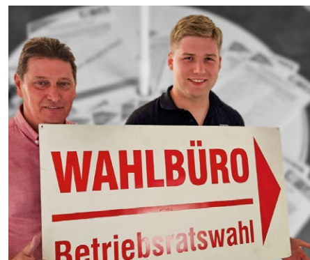
Ab November beginnen die Schulungen für die Wahlvorstände.

igmetall-jena-saalfeld-gera.de/aktuelles