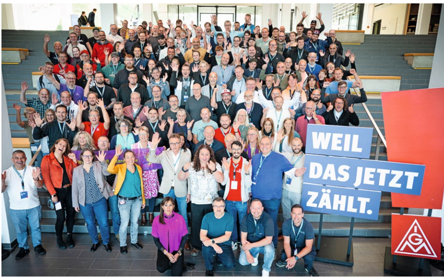
☛ Auf der Mitbestimmungskonferenz machten Betriebsräte und Vertrauensleute deutlich, dass sie hinter der Mobilitätswende stehen.

Bei der Dekarbonisierung gibt es keinen Weg zurück. Die Stahlindustrie im Saarland ist auf einem guten Weg. Dort werden 4,6 Milliarden Euro in den Umstieg investiert.