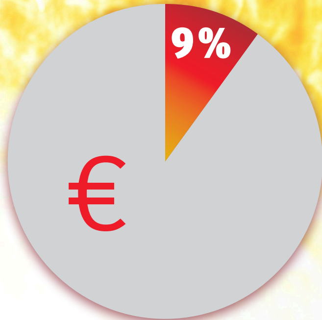
Anteil der Bruttolöhne und -gehälter am Umsatz in der Stahl- und Roheisenerzeugung

Nur 9 Prozent Lohnkostenanteil. 37 Prozent arbeiten schon jetzt unter 35 Stunden.