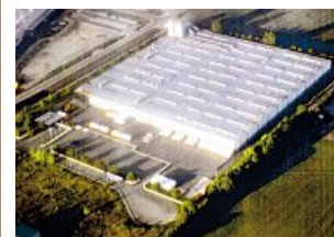
Werksgelände von K+N in Weißensee

Deshalb werden wir um jede Altersgruppe, von den Azubis bis zu den älteren Beschäftigten, separat kämpfen. Es geht um Menschen, die zum Teil über Jahrzehnte beste Arbeit geleistet haben. ■