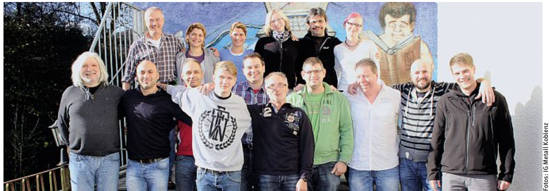
Da lacht die Sonne: die Teilnehmerinnen und Teilnehmer des A1-Seminars in der Brückenmühle Roes