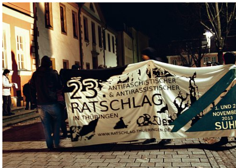
Mahngang durch Suhl am 1. November

Alle einte das Ziel, den Kampf gegen Antifaschismus und Antirassismus zu stärken, sich zu vernetzen, auszutauschen und mitei-