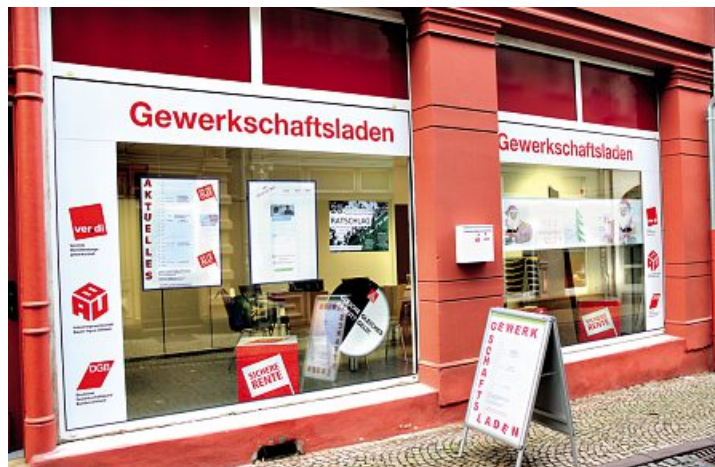
Gewerkschaftsladen in Gotha

Ehrenamtliche Kolleginnen und Kollegen stehen für Gespräche zur Verfügung. Wir wünschen uns, dass noch mehr Kolleginnen