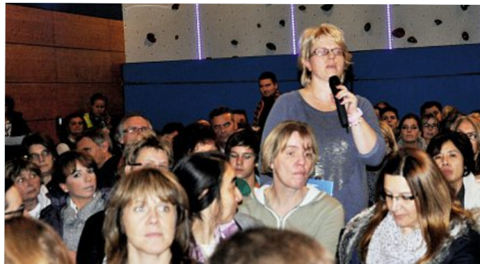
Elternabend am Gutenberg-Gymnasium in Mainz

troindustrie angeführt werden. Die Organisation der Elternabende fand im Bezirk Mitte im Rahmen des Projekts Beruf.Bildung.Zukunft statt. Mit diesem möchte die IG Metall stärker den Einstieg von Jugendlichen in die Arbeitswelt begleiten und bereits in der Schule eine Orientierung auf Gewerkschaften und Interessenvertretung geben. ■