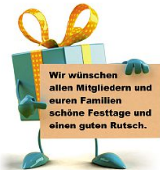
Eure IG Metall Eisenach

Wer noch in diesem Jahr Fragen klären möchte oder in einer Rechtssache eine Frist einhalten muss, kann uns bis einschließlich 20. Dezember wie gewohnt erreichen.