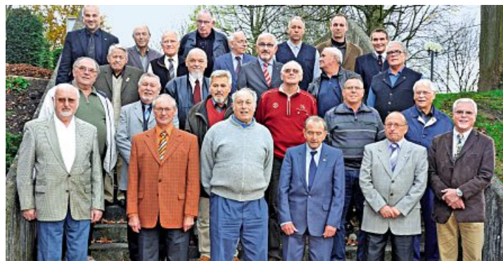
Seit 50 Jahren halten diese Metaller der IG Metall die Treue.