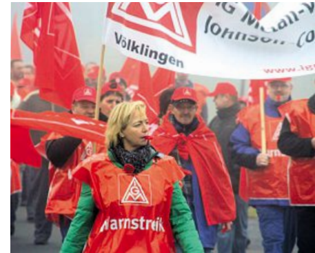
Johnson Controls Headliner in Überherrn

Trotz zahlreicher Warnstreiks und Aktionen unter Beteiligung von bundesweit 3000 Beschäftigten aus 27 Betrieben, gibt es bei den Verhandlungen zu einem Tarifvertrag »Demografie« in der Textil- und Bekleidungsindustrie noch kein Ergebnis.