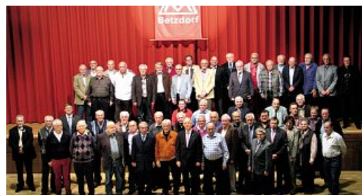
Die Jubilare 2013 auf einen Blick

den vergangenen Jahrzehnten sei es immer wieder gelungen, Arbeitsplätze zu erhalten, Löhne zu steigern und die Arbeitsbedingungen zu verbessern. »Dass die Menschen mit ihrer Arbeit gut leben können, das habt ihr damals ge-