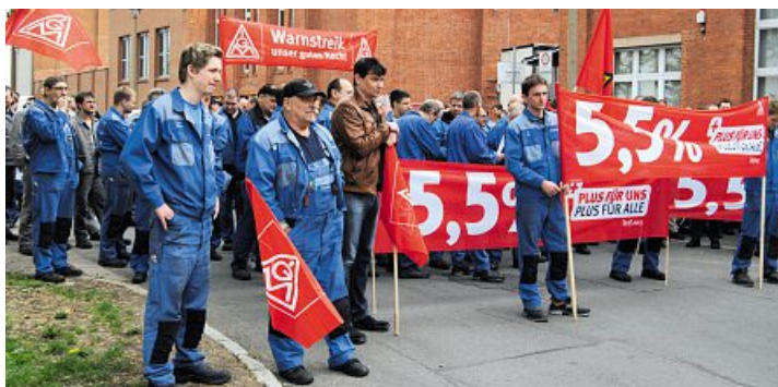
Die Kolleginnen und Kollegen sind jederzeit bereit, für ihre Interessen zu kämpfen. Dies haben sie zuletzt im Mai beim Warnstreik in der Tarifrunde bewiesen.

IG Metall Erfurt Lucas-Cranach-Platz 2 99097 Erfurt Telefon: 0361 - 565 85 - 0 Fax: 0361 - 565 85 - 99 E-Mail: erfurt@igmetall.de Internet: erfurt.igmetall.de Redaktion: W. Lemb (verantwortlich), K. J. Breuer Redaktionsschluss: 15. Nov. (15. 12. für die Januar-Ausgabe)