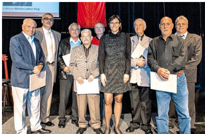
Unsere Jubilare mit 60 Jahren Mitgliedschaft