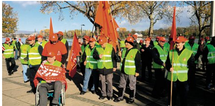
Metallerinnen und Metaller von Lear Gustavsburg am Verhandlungsort in Mainz

Redaktion: Armin Groß (verantwortlich), Grit Rolke