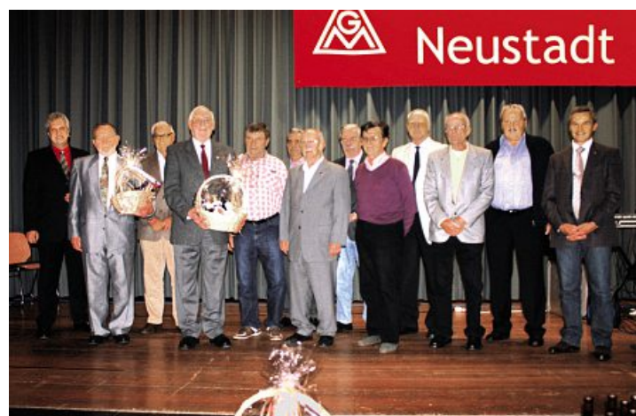
50 und 60 Jahre Mitglied in der IG Metall in Neustadt