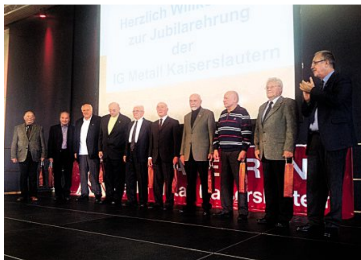
Jubilare in Kaiserslautern

Bei Musik, Speisen und Getränken folgten allerorts nach den Ehrungen der Jubilare anregende Gespräche unter Weggefährtinnen und -gefährten aus ereignisreichen Jahren bis in den Abend. ■