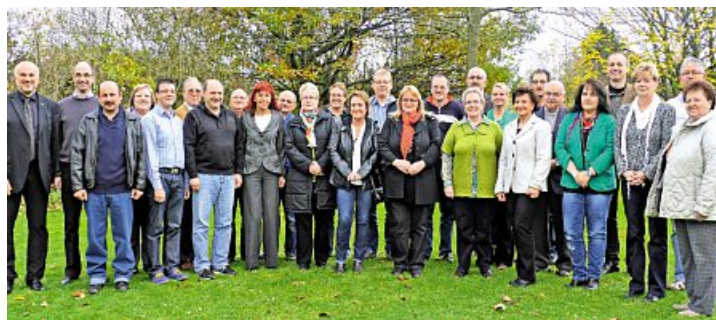
Seit 25 Jahren halten diese Metaller der IG Metall die Treue.