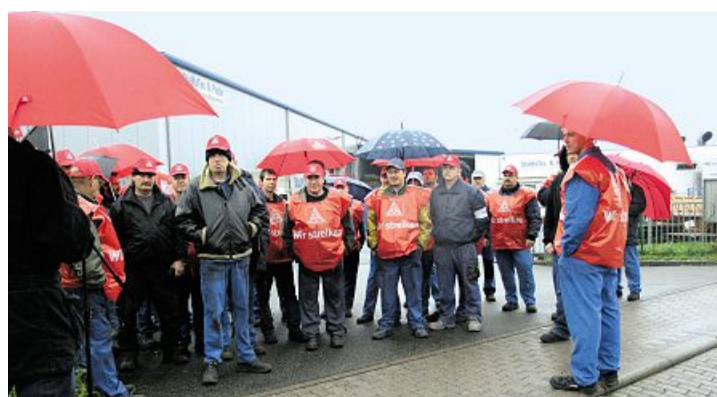
Metaller vor dem Werkstor: Trotz heftigem Regen war der erste Warnstreik bei StaMaTec in Zweibrücken ein voller Erfolg.

Doch die zweite Forderung der Beschäftigten, nämlich nach einer gerechten Bezahlung, scheint dem Eigentümer fast noch schwerer zu fallen. Wochenlang verhandelte die IG Metall mit seinen Beauftragten über einen Haustarifvertrag. Zentrale Forderung: Ein monatliches Grundentgelt von 2220 Euro für Facharbeiter. »Eine Forderung, die sich der Betrieb auch wirtschaftlich leisten kann«,