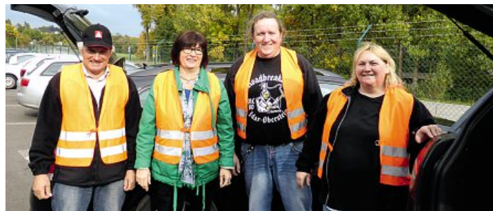
Betriebsräte und Vertrauensleute aus der Region unterstützten die Aktion der IG Metall.

Da vor Ort viele Kolleginnen und Kollegen russischsprachiger Herkunft arbeiten, fand dies alles auf Deutsch und Russisch statt. Mit zweisprachigen Flyern und Stärkungen für das leibliche Wohl wurden die dort angestellten Mitarbeiter am Werkstor begrüßt, um sich anschließend bei der vor Ort anwesenden Roadshow über