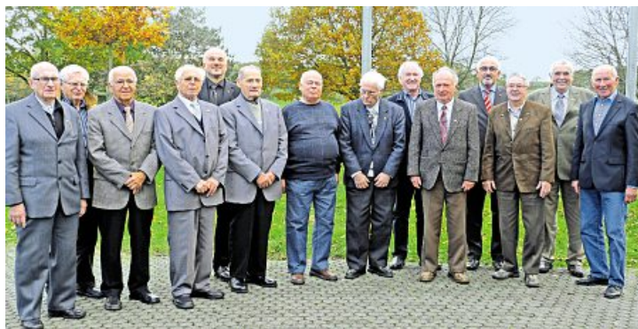
Seit 60 Jahren halten diese Metaller der IG Metall die Treue.

Die IG Metall Mittelhessen dankte und ehrte im November insgesamt 780 Kolleginnen und Kollegen für 25-, 40-, 50-, 60- und sogar jeweils einmal für 80- und 85-jährige Mitgliedschaft in der IG Metall.