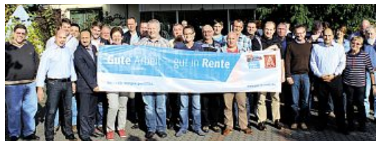
Der erweiterte Ortsvorstand

Metall Betriebsräten zu gewinnen, jüngere Beschäftigte anzusprechen, mehr kaufmännische, technische, IT Angestellte und Ingenieure als Kandidatinnen und Kandidaten für den IG Metall-Betriebsrat zu gewinnen. Die Tarifrunde 2015 für die Metall- und Elektroindustrie soll nicht nur die Entgelte regeln, sondern auch Zu-