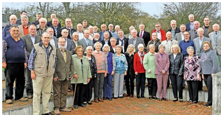
Seit 40 Jahren halten diese Metaller der IG Metall die Treue.

Unser Büro ist vom 23. Dezember bis 3. Januar geschlossen. Am 6. Januar sind wir wieder für Euch im Büro zu erreichen.