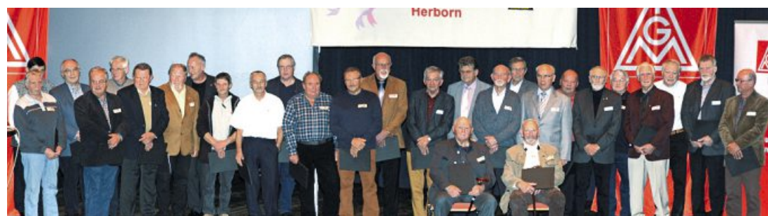
Gruppenfoto der anwesenden Jubilarinnen und Jubilare für 50-jährige (Bild oben) Mitgliedschaft und 40-jährige (Bild unten) Mitgliedschaft mit Kabarettistin »Irmgard Knüppel«