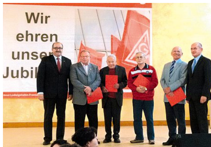
Die langjährigsten Mitglieder der Verwaltungsstelle Ludwigshafen-Frankenthal