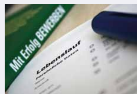
Wann ist der richtige Moment, sich zu bewerben?

Demnach haben 26 Prozent aller Unternehmen bereits Absolventinnen und Absolventen mit Bachelor eingestellt. Bei den Großunternehmen sind es inzwischen sogar fast siebzig Prozent; bis zu zwei Drittel aller Neueinstellungen haben diesen Abschluss. Ein Viertel der Absolventen von Universitäten entscheidet sich direkt nach dem drei bis vierjährigen Studium für einen Berufseinstieg, bei den Fachhochschulen seien es sogar fast vierzig Prozent. Bachelors sind also in den Unternehmen nicht nur willkommen, sondern durchaus auch angekommen.