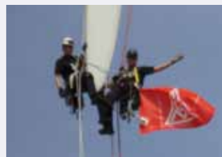
Mit der IG Metall zum Tarifvertrag.

Mehr Infos unter www.i-connection.info > Materialien