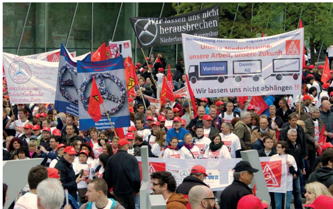
Stuttgart: Beschäftigte und Betriebsräte protestieren gegen den Verkauf von Niederlassungen.

Rund 4 000 Beschäftigte und Betriebsräte der konzerneigenen Niederlassungen protestierten Ende April in Stuttgart gegen die Pläne der Daimler AG. Der Konzern will die Umsatzrendite auf ganze zehn Prozent steigern. Er setzt dabei auch auf einen Kahlschlag im Vertrieb. Über 15 000 Beschäftigte in 33 Niederlassungen fürchten die Ausgliederung aus dem Unternehmen und den Verkauf von Betrieben bis hin zu ganzen Niederlassungen. Damit würden sie ihren jetzigen tariflichen Schutz verlieren. Ein „Zukunftssicherungsvertrag“ zwischen der Daimler AG und dem Gesamtbetriebsrat sowie der IG Metall schließt zwar den Verkauf von Niederlassungen bis Ende 2015 aus. Doch vernünftige Konzepte, die den Beschäftigten eine echte Zukunftsperspektive bieten, hat der Konzern bislang nicht vorgelegt.